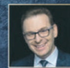
REŻYSERIA I NARRACJA ŁUKASZ LECH

Maciej Nieć - fortepian Mieczysław Smyda - skrzypce