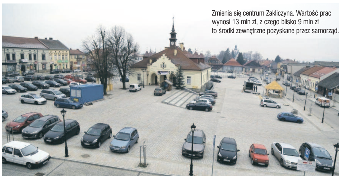
Zmienia się centrum Zakliczyna. Wartość prac wynosi 13 mln zł, z czego blisko 9 mln zł to środki zewnętrzne pozyskane przez samorząd.