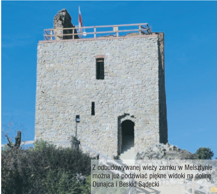
Z odbudowywanej wieży zamku w Melsztynie można już podziwiać piękne widoki na dolinę Dunajca i Beskid Sądecki

Wykonano prace związane ze stabilizacją osuwiska wraz z odbudową drogi gminnej Paleśnica – Dzierżaniny. W ub. roku